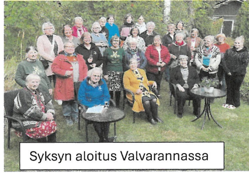
Syksyn aloitus Valvarannassa