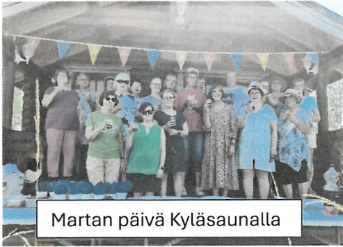
Martan päivä Kyläsaunalla