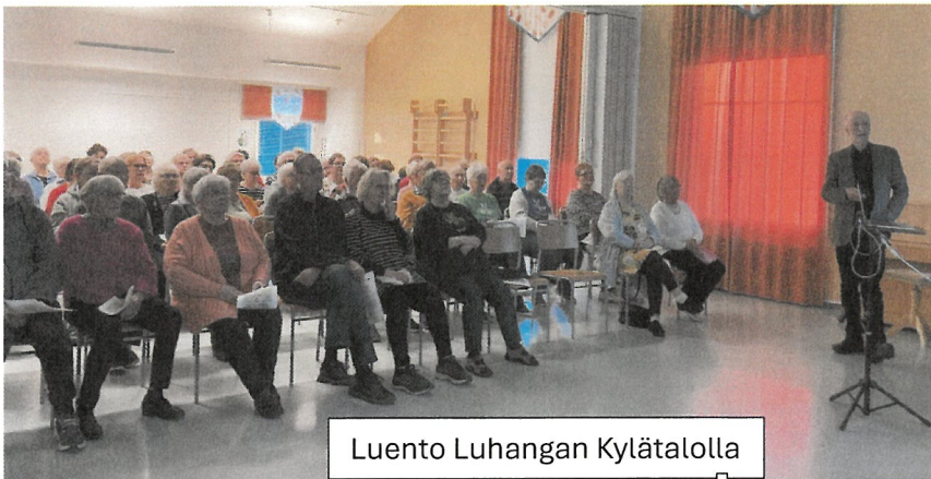
Luento Luhangan Kylätalolla