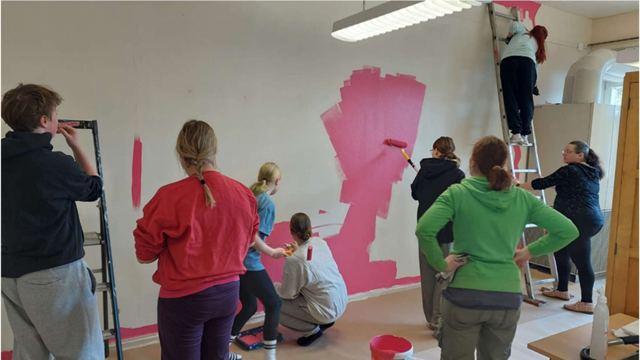
Kuvat 1. ja 2. Nuorisokahvilan tilojen remontointia keväällä 2025.