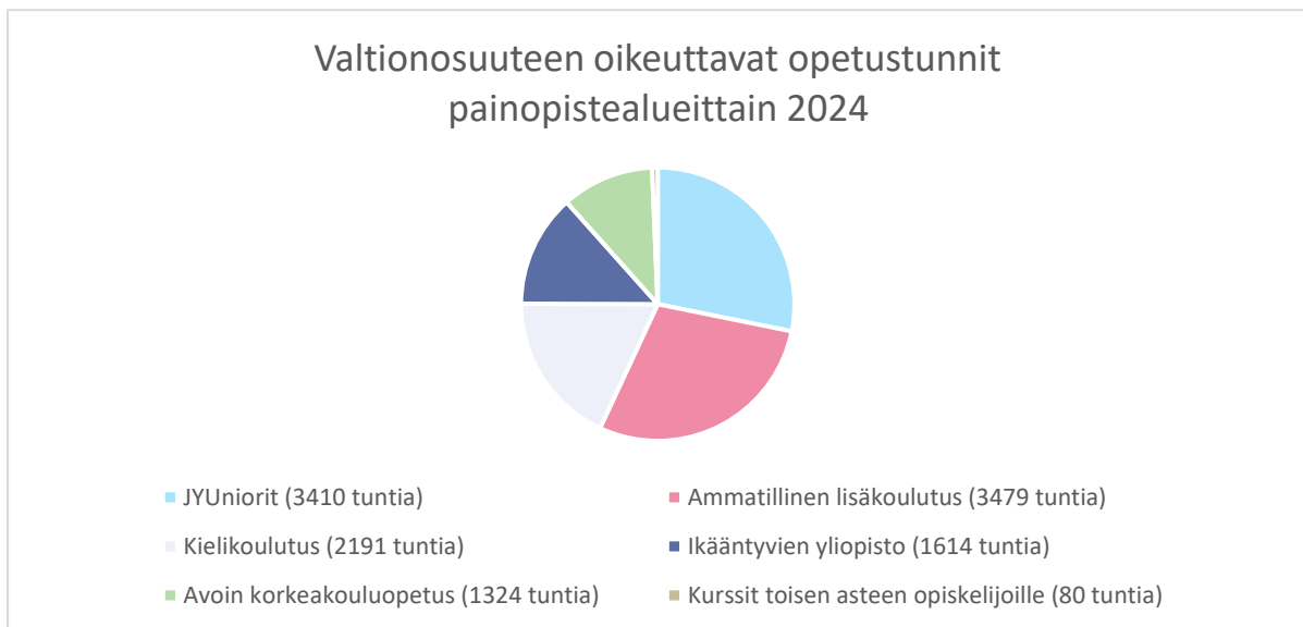
Kuvio 1. Valtionosuuteen oikeuttavien opetustuntien jakautuminen painopistealueille 2024.

tarvittavaa osaamista vahvistavat koulutuskokonaisuudet ja lasten tiedeperusteinen harrastustoiminta. Myös avoin korkeakouluopetus ja suomen kielen koulutus vahvistui aiempiin vuosiin verrattuna.