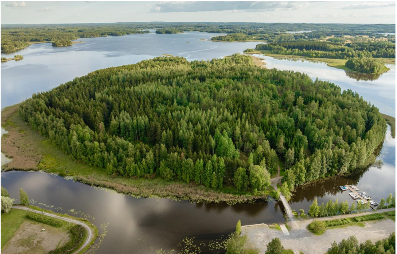
Ohrasaaren sillan uusiminen mahdollistaa jatkossa virkistysalueen rakentamisen ja kunnossapidon.