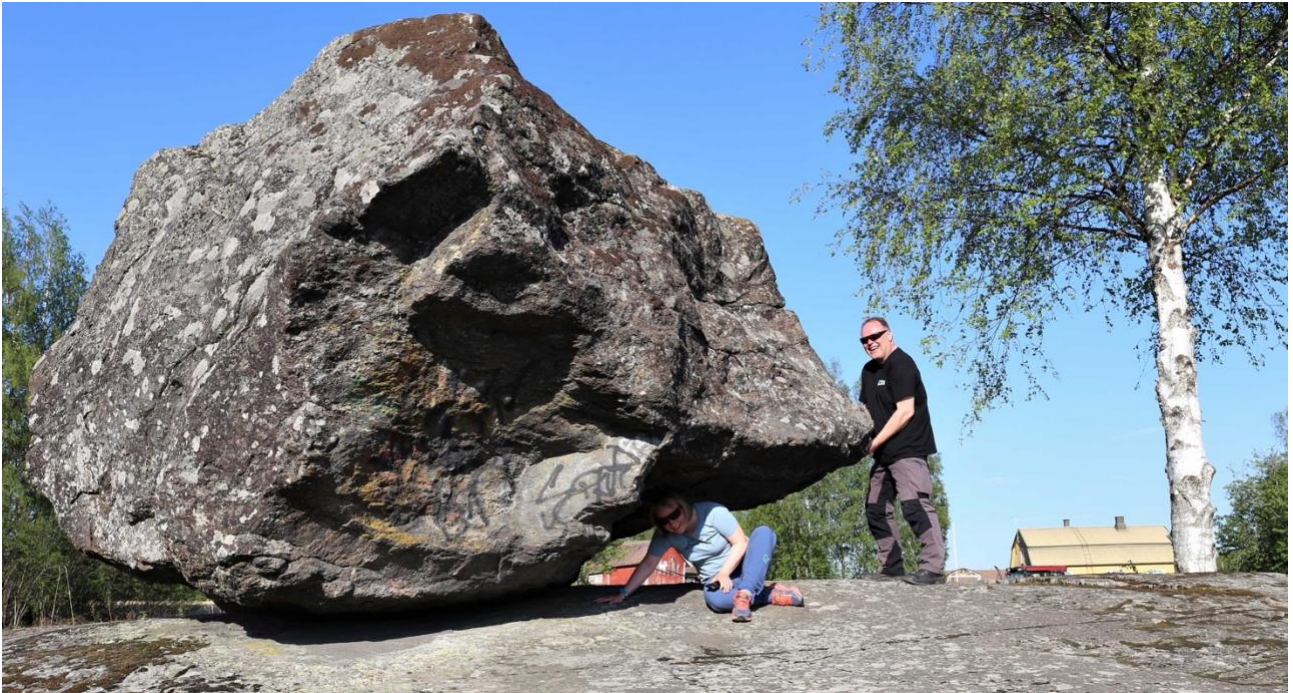
Onkiniemen yleiskaavallisen tarkastelun tavoitteena on yleissuunnitelmanlaadinta.